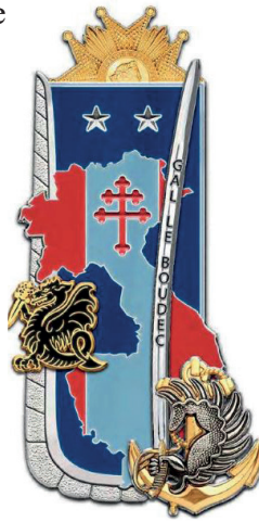
L'insigne de la promotion

coloniaux de Bayonne. Le 6 janvier 1960 il est affecté comme chef d'état-major du 7 ème régiment parachutiste d'infanterie de marine à Dakar puis le 1 er avril 1963 comme directeur de l'instruction combat à l'école des troupes aéroportées de Pau. Il est promu chef de bataillon et fait