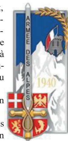
L'insigne de la promotion

Cette bataille conduite de haute lutte durant près de deux semaines par l'Armée des Alpes prend fin avec l'armistice des 22 et 24 juin 1940 signée par la France, respectivement avec l'Allemagne et l'Italie. Les pertes italiennes ont été d'environ 6 000 hommes contre près de 250 soldats pour l'armée des Alpes. Celles du groupement Cartier face aux Allemands n'ont toutefois pas été retenues par l'Histoire. ■